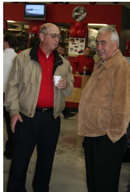
Figure 8. J.M. Chagnon inc. Coaticook, le 2 novembre, 2006. Membre du Club Raymond Chagnon parle avec un client à l'ouverture du nouveau centre.

Des centaines de personnes, clients et intéressés ont assisté à l'ouverture des nouveaux locaux. C'était un grand événement : la coupure d'un ruban pour souligner l'ouverture et une visite libre des lieux, des discours présentés par les propriétaires, représentants de Case-IH, et autres personnes. Ainsi que le dévoilement de la nouvelle série de tracteur Puma.