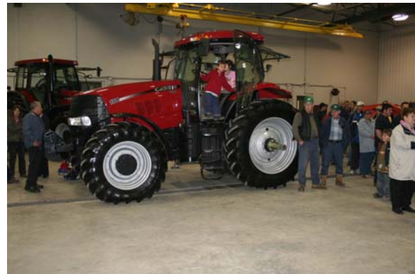
Figure 7. J.M. Chagnon inc. Coaticook, le 2 novembre, 2006. Dévoilement de la nouvelle série Puma.

travail au département de la mécanique. Il y a trois conseillers aux ventes. Raymond travaille encore à temps partiel comme conseiller aux ventes.