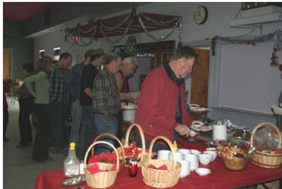
Figure 1. Les membres et leurs invités au brunch de Noël. Salle Guy Veilleux, Cookshire QC. Le 3 décembre, 2006.