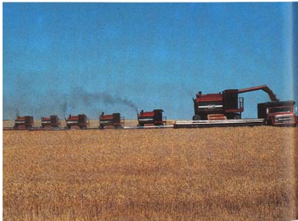
Cutting south of Kremlin, Montana, August 1979.

pour traîner les batteuses sur remorque et pour transporter le grain.