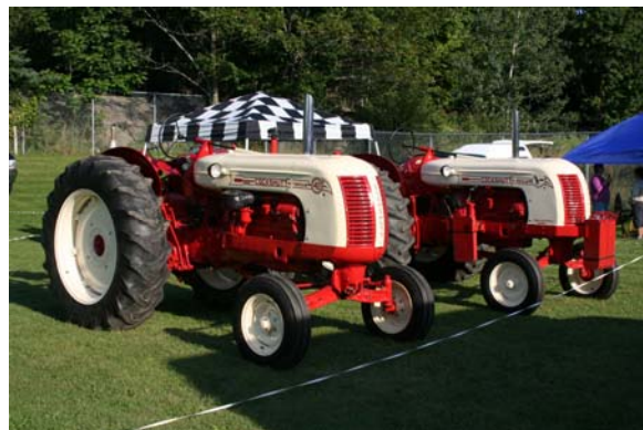
Figure 7. Expo 2010, Compton QC, le 21 août. Deux beaux Cockshutts (40, Golden Eagle D4) de Jack McAuley.

Alors, après ces discussions, la résolution suivante a été déposée :