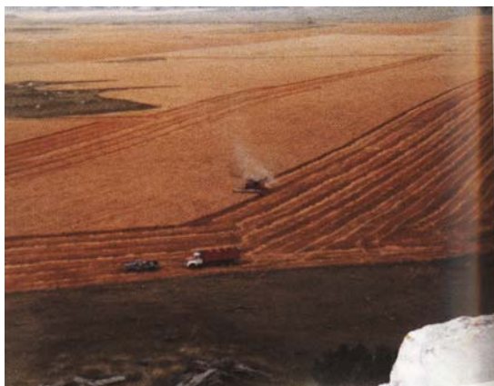
Figure 10. Vue aérienne du battage du blé dans Colorado 1983. Du livre 'Starks Harvesters', Robert White

Il commençait au Texas et montait jusqu'en Saskatchewan, une distance de 2,000 miles. En fait, la compagnie canadienne Massey Harris a transporté la pratique de moissons du Texas au Canada en 1944 avec la Brigade des moissons. Massey Harris a produit la première batteuse qui a connu un succès commercial en 1938.