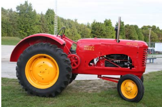
Figure 4. Expo 08 Compton. Massey Harris 102 de Yvon Cloutier.

Et il y avait bien d'autres engins qui tournaient.