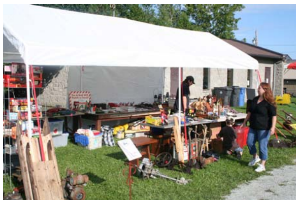
Figure 3. Expo 08 Compton. Marché aux puces. Kaylon Sarrasin et Sylvia Young.

Il y avait cinq vendeurs qui ont participé dans le marché aux puces. Ils vendaient une gamme très vaste d'articles comme les anciennes tondeuses, radios, outils, des macarons, épinglettes de villes et d'autres catégories et bien d'autres vieux objets. Les vendeurs étaient placés proche de l'entrée chaque côté du chemin. Le marché aux puces a ajouté un élément intéressant à l'exposition.